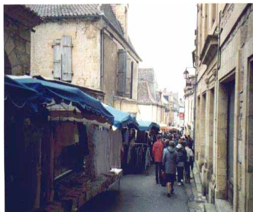
Rue Jean Jaurès un jour de marché