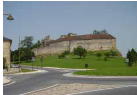
Ce corps de bâtiment comportait les écuries

Cette promenade dans Excideuil vous a plu et vous souhaitez en savoir davantage... Il existe des visites commentées et gratuites de la ville en juillet et en août (départ de l' O.T. le jeudi à 15h00)