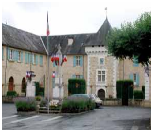
Monument aux Morts et Hôpital Local