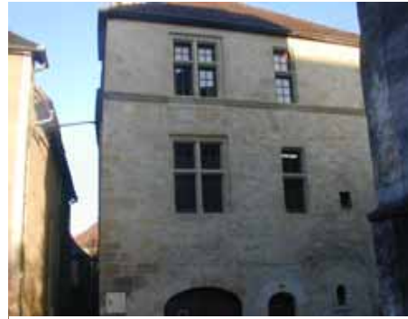
Commanderie des Templiers